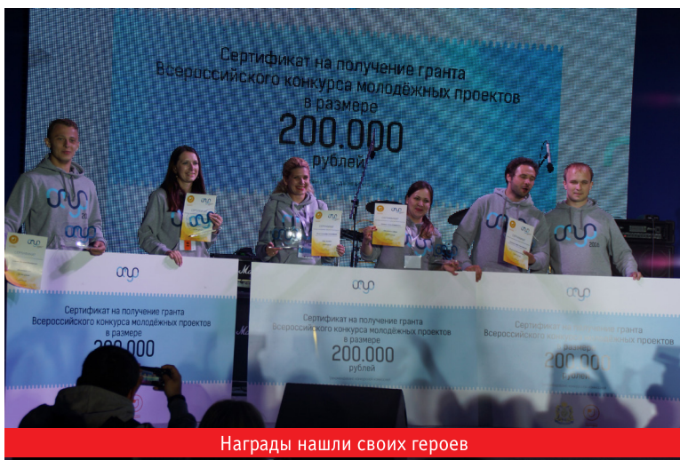
Награды нашли своих героев