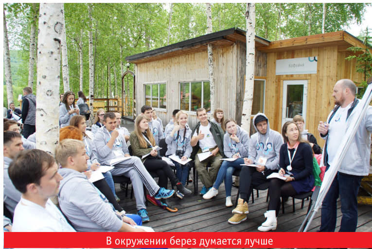
В окружении берёз думается лучше

тать вполне жизнеспособные и актуальные программы развития. Разбившись на группы, участники первой смены разрабатывали коллективные проекты в различных сферах управления городом — ЖКХ и городское хозяйство, инновации и инженерия, управление человеческим капиталом, культура, туризм и других, а проекты второй смены в основном были посвящены вариантам использования