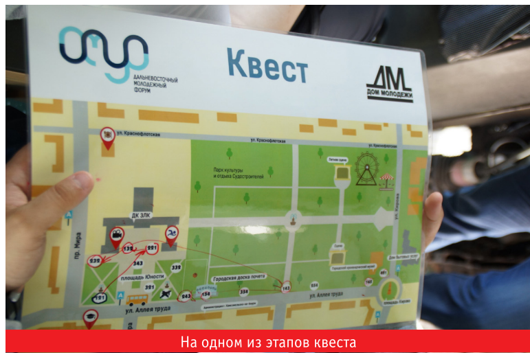
На одном из этапов квеста

«дальневосточного гектара» и обслуживающим эту программу технологиям. Помимо проектной работы, в образовательную программу было встроено множество интересных лекций от компетентных экспертов, которые передали такой багаж знаний, который предстоит ещё внимательно разбирать, просматривая и прослушивая аудио- и видеозаписи, сделанные во время лекций. Интенсивность обучения было очень высока — начиналось оно в 9 часов утра, а заканчивалось в районе 23:00. А некоторые после этого ещё доделывали свои проекты. Поэтому справедливо было подмечено в гимне форума «Амур»: «Каждый из нас крепче, чем сталь, и каждый готов покорить эту даль».