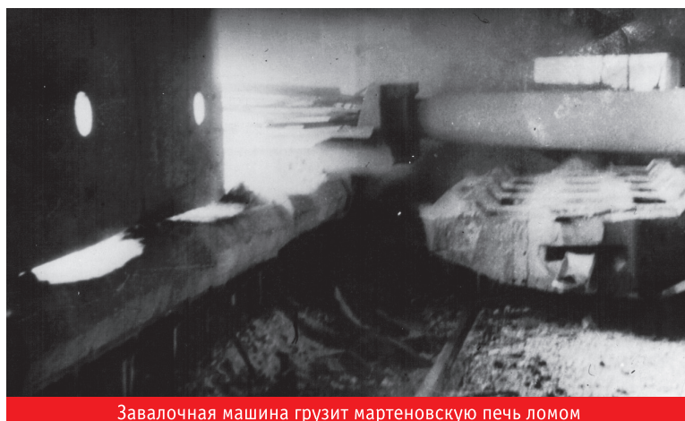
Завалочная машина грузит мартеновскую печь ломом

Период 1995–1996 годов стал завершающим в работе сталеплавильных и сталеразливочных агрегатов. Только 71061 тонну составила выплавка стали, а производство слябов (в том числе за счёт «огненного моста») — 79272 тонны. Последняя разливка мартеновской стали на МНЛЗ № 3 была произведена 22 декабря 1995 года, последняя разливка стали ЭСПЦ № 2 на МНЛЗ № 1 (машины №№ 1–2) — 30 ок-