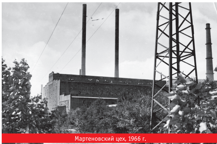
Мартеновский цех, 1966 г.