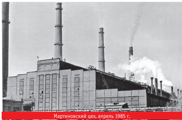
Мартеновский цех, апрель 1985 г.

тября 1996 года. Последняя разливка на МНЛЗ № 2 (машины №№ 3–4) произведена 6 ноября 1996 года. Выплавка стали в 1996 году составила только 10463 тонны, производство слябов: мартеновских — 10388 тонн, слябов металла ЭСПЦ № 2 — 3556 тонн.