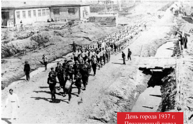
День города 1937 г. Праздничный парад

Мы продолжаем публикацию рассказа Геннадия Хлебникова об одной из заслуженных семей первостроителей, внёсших значимый вклад в строительство завода «Амурсталь» и Комсомольска-на-Амуре.