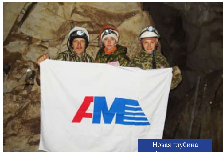
Новая глубина «Амурметалла»