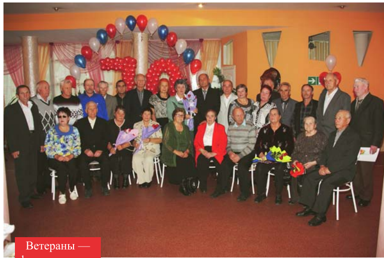
Ветераны — фото на память

В «состязании» участвовали не только самые большие овощи и корнеплоды. Также приветствовалась ори-