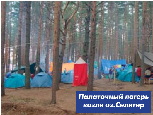
Палаточный лагерь возле оз. Селигер