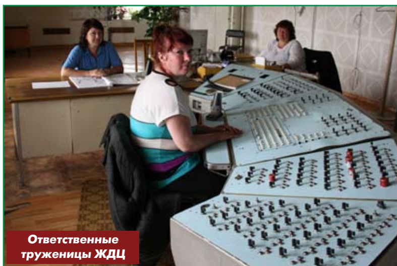
Ответственные труженицы ЖДЦ

Отрадно отметить тот факт, что мы потихоньку выходим из кризиса. В прошлом году в Новосибирске был отремонтирован тепловоз ТГМ-4-2633, в этом году там же прошёл капитальный ремонт тепловоз ТГМ-6-0055, и он уже успешно прошёл обкатку в нашем цехе. Вслед за ним на ремонт ушёл ещё один, третий по счёту, тепловоз. Тем не менее тепловозный парк требует обновления, особенно актуальным этот вопрос станет после запуска второй технологической линии. Сегодня у нас в парке 14 тепловозов, 256 вагонов, 6 кранов, а также эксплуатируется более 73 километров пути (а вместе с путями в цехах — около 98 км) и 238 стрелочных переводов. Однако при работе двух технологических линий нам потребуется минимум 15 рабо-