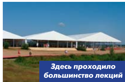
Здесь проходило большинство лекций