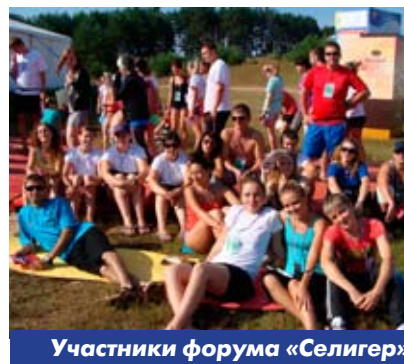
Участники форума «Селигер»

Программа смены была очень насыщенной, на все лекции, которые бы хотелось сходить, побывать не получалось, потому как в одно и то же время могло идти до 10-ти лекций.