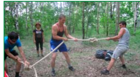
Сначала командой распутать узлы, а затем... запутать для другой команды!