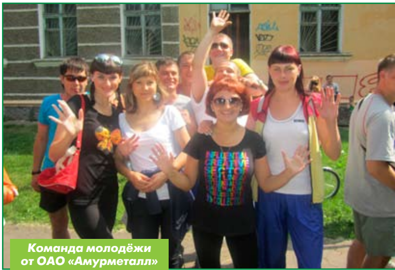
Команда молодёжи от ОАО «Амурметалл»

Вызывая некоторое удивление у нечастых прохожих, по парку железнодорожников слюня голову носились десять команд — так проходила 2 июля туриада среди рабочей и служащей молодёжи «Таёжные тропы», посвящённая Дню молодёжи. Участие в соревнованиях, которые проходят уже четвёртый раз и организатором которых выступил отдел по делам молодёжи администрации города Комсомольска-на-Амуре, приняли команды от различных предприятий города: ОАО «РЖД», ОАО «АСЗ», ОАО «КНААПО» и другие. Среди них была и молодёжная команда от нашего завода «Амурметалл».