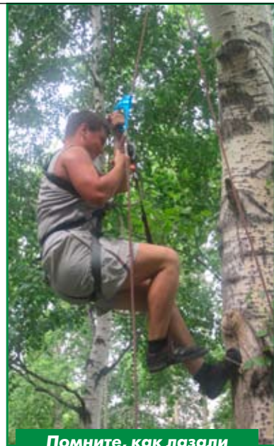
Помните, как лазали в детстве по деревьям? А теперь со снаряжением!

заняла третье место. Вторыми на городской туриаде «Таёжные тропы» стали представители комсомольского филиала ОКБ «Сухого» — команда «Сухой».